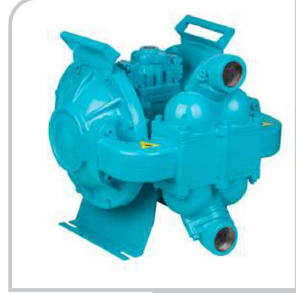
DPH - 20

Ağır Hizmet Pompaları / DPH - 20 Heavy Duty Pumps / DPH - 20