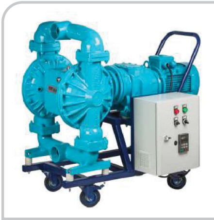
DP - 30E

Elektrikli Diyaframlı Pompalar / DP-30E Electromechanical Diaphragm Pumps / DP-30E