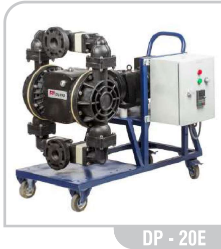
DP - 20E