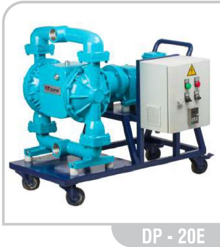
DP - 20E

Elektrikli Diyaframlı Pompalar / DP-20E Electromechanical Diaphragm Pumps / DP-20E