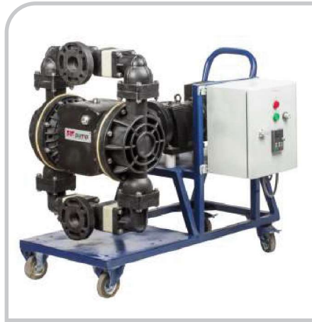
DP - 30E